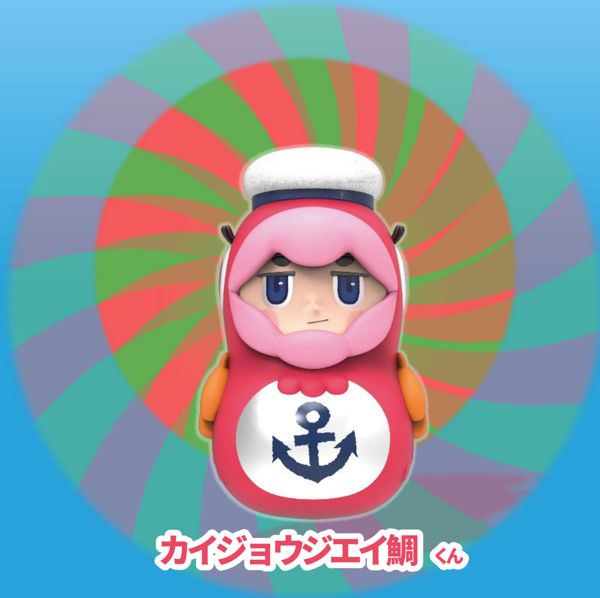
カイジョウジエイ鯛くん