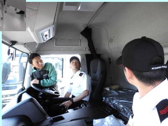
トラック実車見学