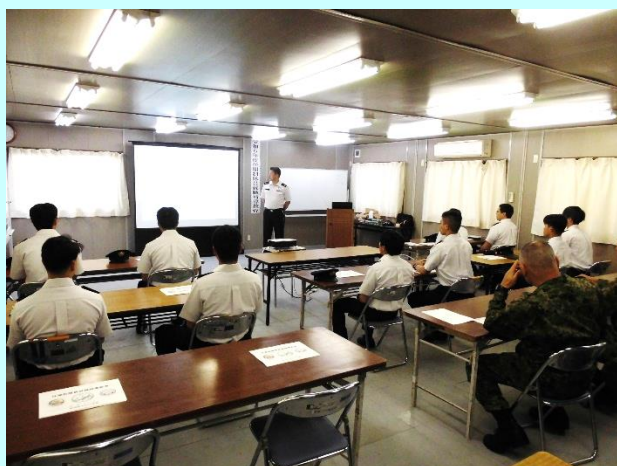
新発田駐屯地援護室長「職業選択等」