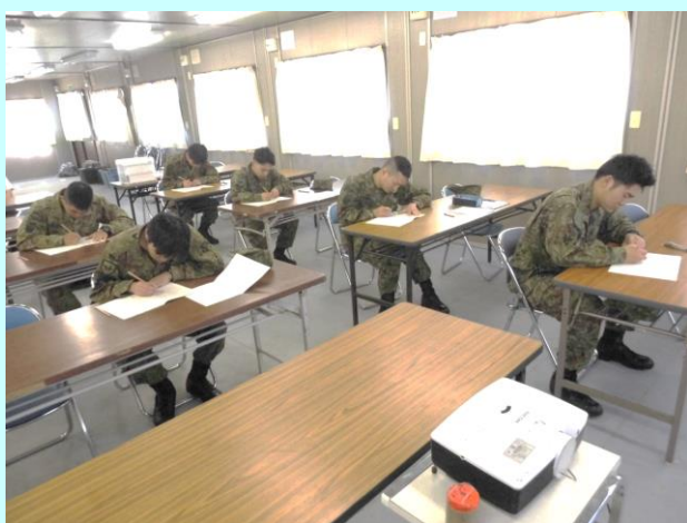
任期制隊員「職業適性検査」

就職補導教育は、本年度退職を予定している隊員に対して、退職後の就職にあたって参考となるように、援護室長、部外講師による講話及び企業研修により社会労働情勢等職業選択に必要な知識を付与することを目的としています。