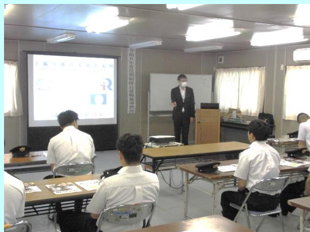
新潟地本予備自衛官室長「予備自衛官等制度」