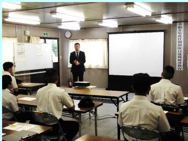
新潟地本援護課長「教育にあたって」