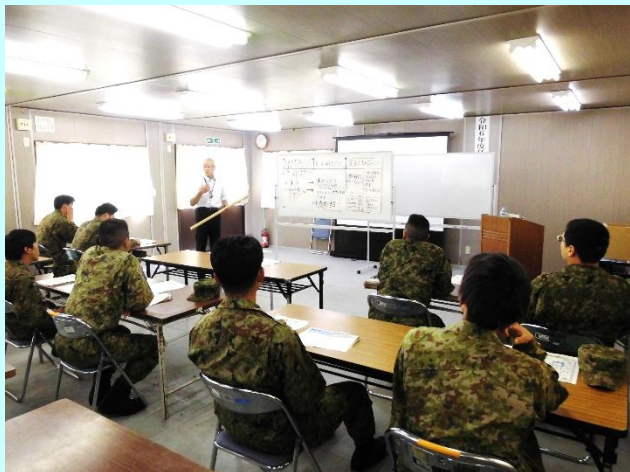
ハローワーク講師「再就職活動の進め方」