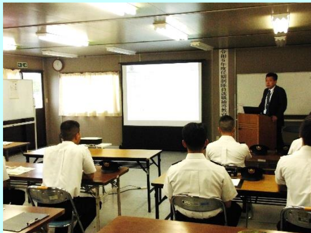
自衛隊援護協会講師「面接時の心構え」