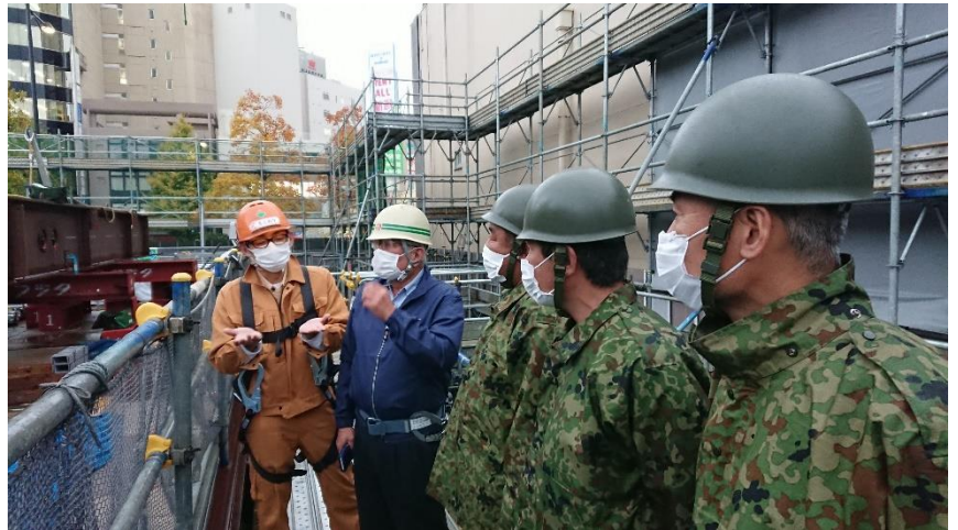
【9日 (株)岡部工務店 様の日本生命ビル施工現場を見学する隊員】

この「インターンシップ」は、若年定年（50代）退職予定隊員が就業体験等を行うことで、再就職先選択の職域拡大やミスマッチによる早期離職防止を図ることを目的に各地方協力本部計画で実施しているものです。また、受け入れ企業様に対して、退職自衛官雇用の有用性周知を目的としている事業でもあります。