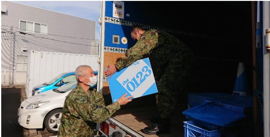
【8日 アートコーポレーション(株) 様にて業務体験に奮闘する隊員】