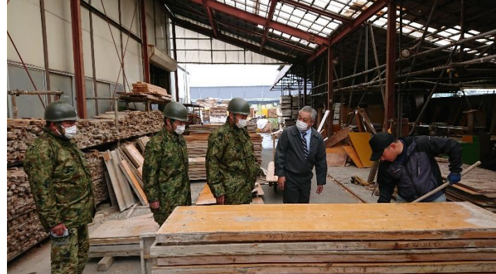
【アートコーポレーション(株)様で模擬荷物梱包を体験する隊員】