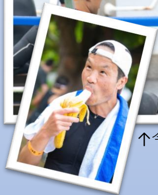
↑今年も長女が撮影してくれました。