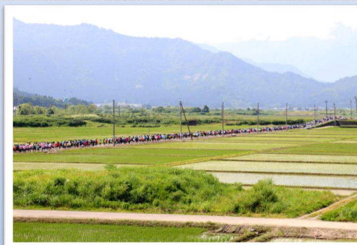
↑魚沼の美しい田園風景を眺めながら走ることができます。