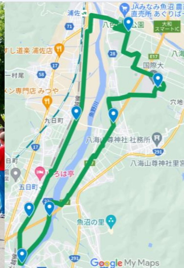
↑スタート・ゴール地点は八色(やいろ)の森公園。21kmのハーフマラソンです。