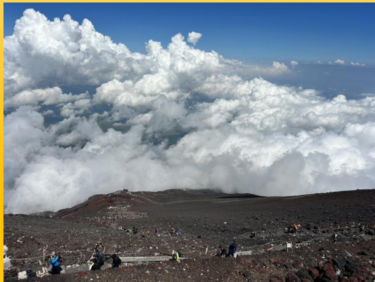
↑雲を下に眺める絶景！ぜひ現地で見ることをお勧めします。

今年の夏も暑いですね！今回、夏季休暇を利用し人生2度目となる富士登山に行きました。1度目は7年前、吉田ルートで登りましたので、今回は須走（すばしり）ルートに挑戦。出発当初は快晴で絶好の登山日和かと思えば下山時には激しい雷雨に遭いずぶぬれとなってしまうなど山ならではの天候の急変もありましたが、登山者同士の交流もあり気持ちのいい疲労感を得ながら無事帰還することができました。何よりも山頂の絶景で食べるカップ麺は格別です！