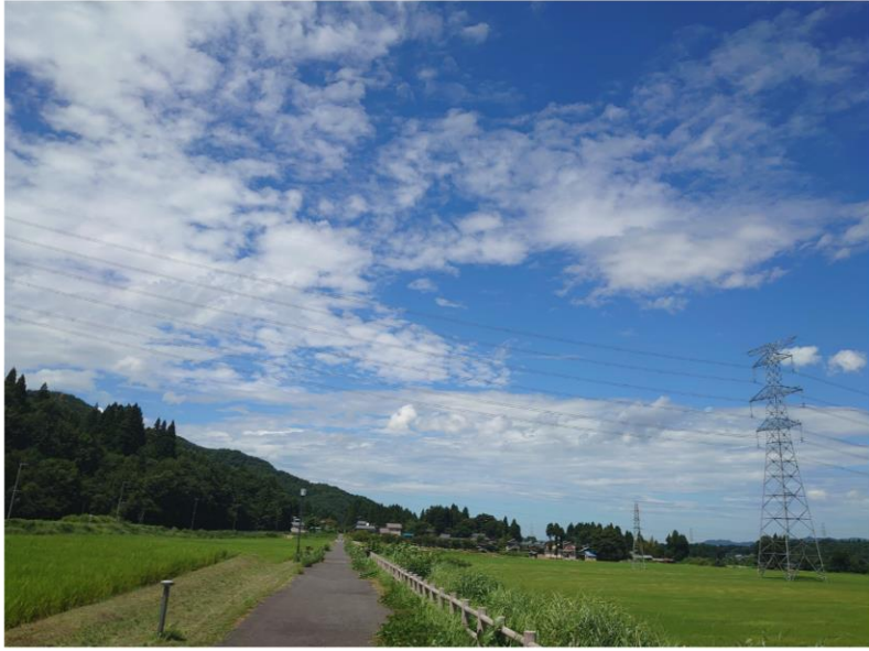
↑13日夜に出発して明けた14日、昼頃に撮った写真です。

夏休みシーズン、皆様いかがお過ごしですか？私は今回夏季休暇を利用して、自主的に徒歩行進訓練を実施しました。13日の19時に出発し、14日の17時まで約22時間で村上から阿賀町までの約70kmを完歩。天候にもめぐまれ気持ちのいい行進となりました。