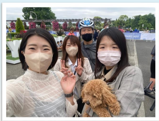
↑家族で記念写真！今回の競技中の写真は全て長女(左)が撮ってくれました。