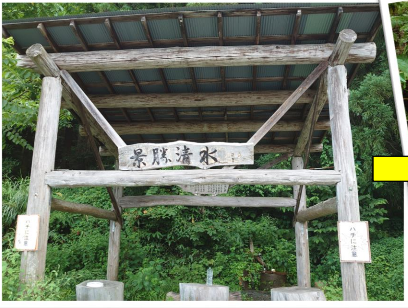
↑阿賀町の山中を行く途中、湧き水を発見！とても美味しかったので、皆さんも立ち寄ってみてください。