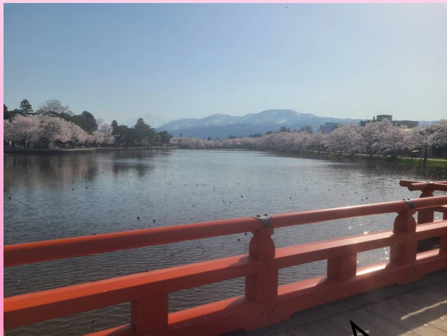
↑高田城址公園の西堀橋から撮影されたものです。