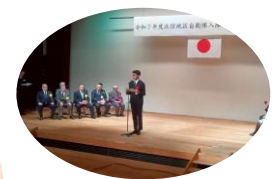
入隊予定者の挨拶