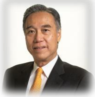
長野県知事 阿部 守一

明けましておめでとうございます。謹んで新春のお慶びを申し上げます。 近年、長野県では多くの災害に見舞われました。発災から今年で十年目となる御嶽山噴火災害、令和元年東日本台風災害等では、松本駐屯地をはじめとする自衛隊の皆様には災害派遣により、被災者の救出救助活動等に当たっていただき、令和五年度には、霧ヶ峰高原での林野火災において、消火活動に御尽力いただきました。 こうした災害発生時はもとより、平素から県民の生命・財産を護るお取組みをいただいていることに、心より感謝を申し上げます。 長野県としましては、令和六年能登半島地震の教訓を踏まえ、地震対策の更なる充実・強化を図るため、長野県地震防災対策強化アクションプランを策定しました。『地震災害死ゼロ』に挑戦」という高い目標を掲げ、予防、応急、復旧復興の各段階に応じた十のアクションを設定し、本県の防災・減災対策の充実・強化を進めているところです。 市町村等と協力して、頻発化・激甚化する自然災害から県民の生命と財産を守り、安全で安心な長野県づくりを推進するとともに、避難所環境の整備、孤立集落への対策などに全力で取り組んでまいりますので、皆様の御支援、御協力をお願い申し上げます。 結びに、自衛隊長野地方協力本部の益々の御発展を心よりお祈り申し上げます。新年の御挨拶といたします。