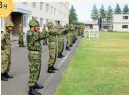
予備自衛官招集訓練