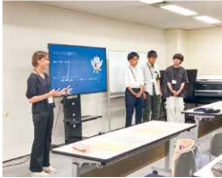
グループ討議・発表