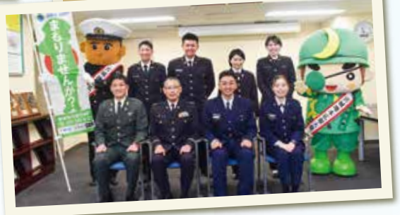
令和5年度宮城地本広報大使委嘱