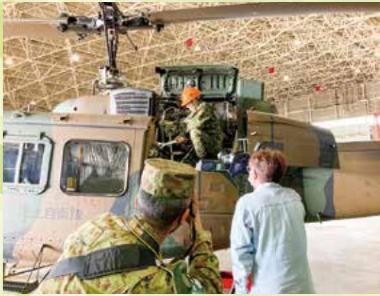
取材受けの様子(東北方面航空隊・自衛隊仙台病院)