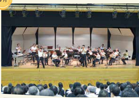
第6音楽隊松島ふれあいコンサート・松島中学校演奏指導