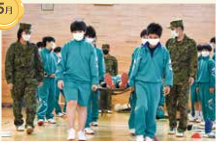
防災学習(仙台市立宮城野中学校)