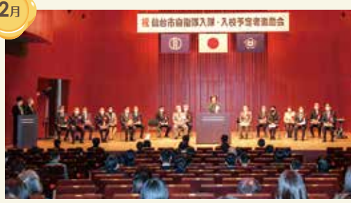
入隊予定者激励会(仙台市)