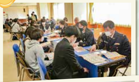
6機関公務員合同職業説明会