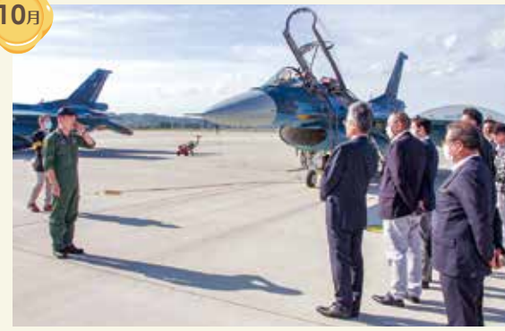
退職自衛官雇用企業主松島基地研修