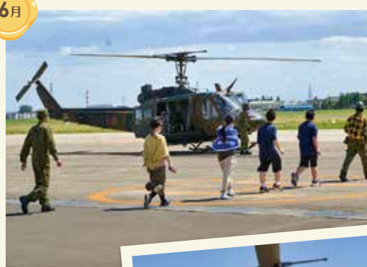
UH-1J体験搭乗(霞目駐屯地)