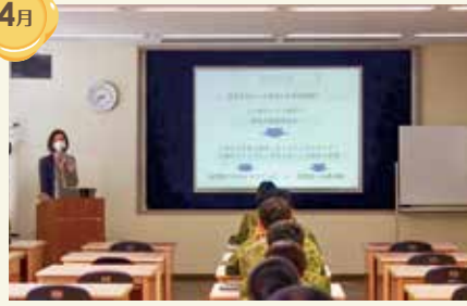
任期制隊員ライフプラン集合訓練