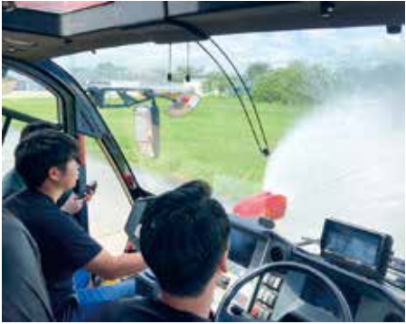
ストライカー放水体験