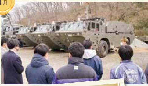
入隊予定者フォローイベント(船岡駐屯地)