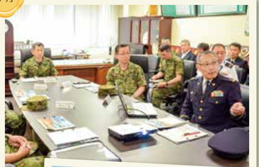
陸上幕僚長初度視察受