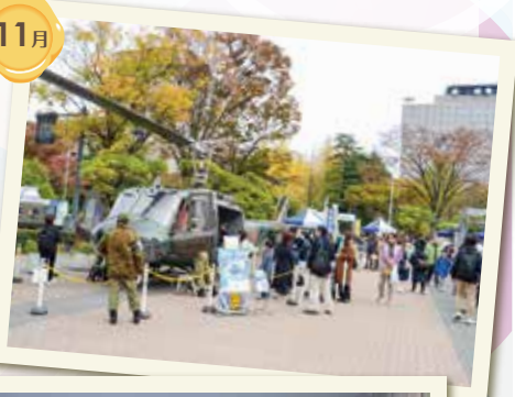
部外広報(PTAフェスティバル)