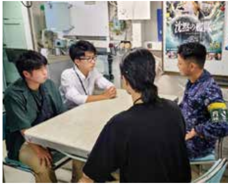
「ときわ」乗組員との懇談