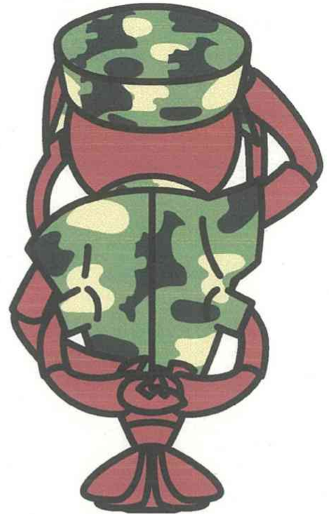
●モデルキャラクター（背面）