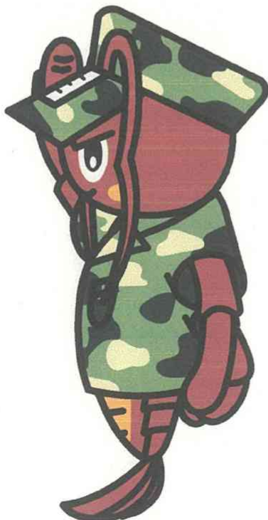
●モデルキャラクター（側面図）