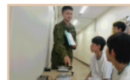
体験学習「通信業務体験」