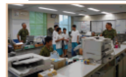
施設見学「執務室見学」