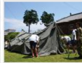
久居西中学校 様 (久居駐屯地での職場体験)