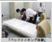
「ベッドメイキング体験」