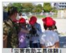
「災害救助工具体験」