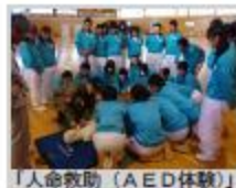
「人命救助 (AED 体験)」