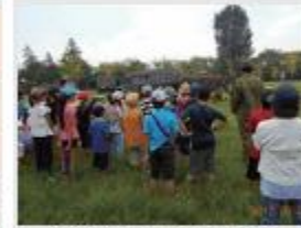
百合が丘子供クラブ 様 (久居駐屯地での職場体験)