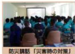
防災講話「災害時の対策」