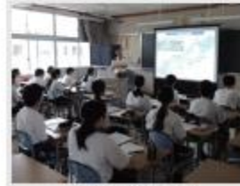
八風中学校 様 (学校での防災講座)