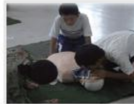
久居東中学校 様 (久居駐屯地での救護体験)