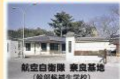
航空自衛隊 奈良基地 (幹部候補生学校)