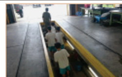
施設見学「車両整備見学」