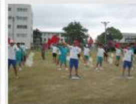
南が丘・一身田中学校 様 (久居駐屯地での職場体験)