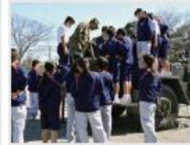
玉城中学校 様 (学校での防災教育)