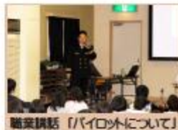
職業講話「パイロットについて」