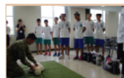
体験学習「応急処置体験」