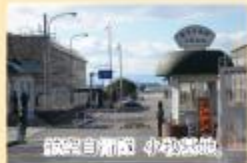
航空自衛隊 大湊基地