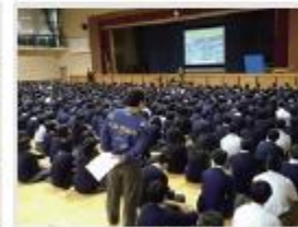
久居高校 様 (学校での防災講座)