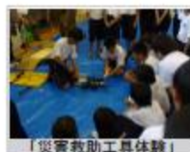
「災害救助工具体験」