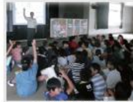
高茶屋小学校 様 (学校での防災講座)