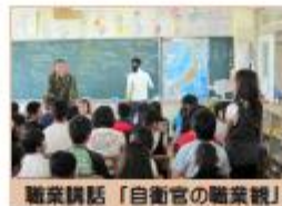
職業講話「自衛官の職業観」