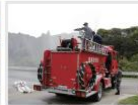
名張高校 様 (白山分屯基地での消防体験)