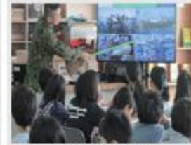
射和小学校 様 (学校での防災講座)