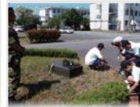
久居西中学校 様 (久居駐屯地での職場体験)