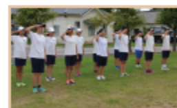
体験学習「基本教育体験」