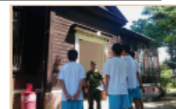
施設見学「資料館見学」