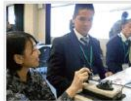
名張高校 様 (笠取山分屯基地での通信体験)