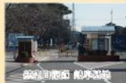
航空自衛隊 大津基地