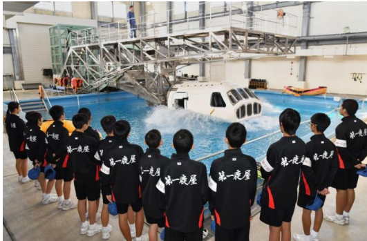
着水脱出訓練装置見学