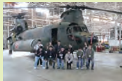
【搭乗前の記念撮影】