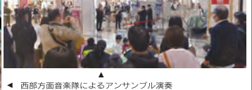
西部方面音楽隊によるアンサンブル演奏