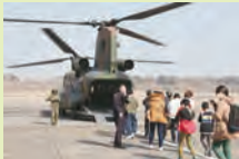
さあ、乗り込むぞー!