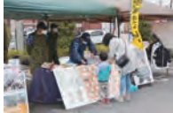
募集・広報ブース

また、店側からは「地域貢献」の位置付けで「今後もっと自衛隊のPRに貢献できれば」との御言葉を頂き、更なる自衛隊に対する理解促進を図ることができました。