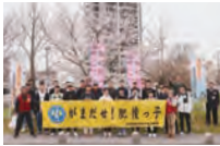
桜も応援してくれています