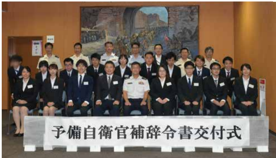
予備自衛官補辞令書交付式

交付式には、7月1日付で採用された予備自衛官補18名のうち17名が参加し、皆一様に緊張を隠しきれない様子で、自衛隊(駐屯地)の正門をくぐり「凄い、広い、迷子になる。」など驚いた様子を見せていました。