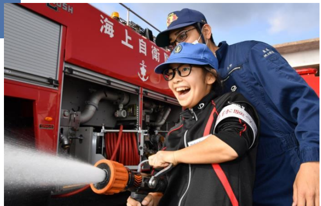
放水訓練体験（海自鹿屋例）