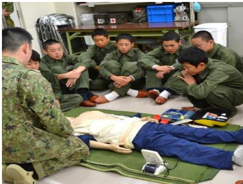
応急救護体験（AEDの操作）