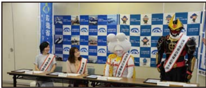
懇談会でのひとコマ

鹿児島地本は、4月4日（木）鹿児島第2地方合同庁舎内において、「平成31年度鹿児島県自衛隊広報大使委嘱式」を行いました。