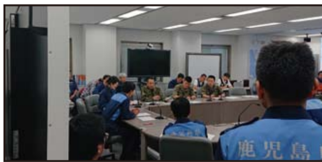
災害対策本部会議