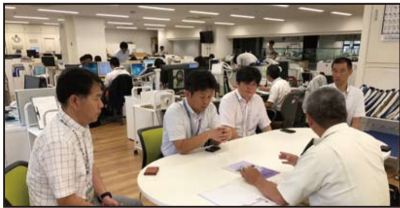
奄美市役所での、総務課長、危機管理室長等に対する地域防災マネージャーに関する説明

鹿児島地本は、部隊新設に伴い、更に就職支援基盤を充実させる必要があります。鹿児島援護センターと奄美大島駐在員事務所、奄美駐屯地等、更には奄美市自衛隊協力会、隊友会奄美支部や奄美市防衛協会青年部会との緊密な連携を図りつつ、継続的な離島援護業務を着実に推進していくとしています。