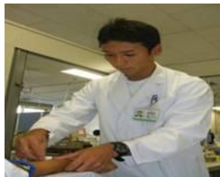
(健康診断の検診処置)