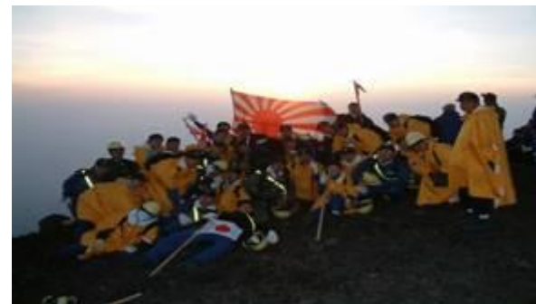
(衛生課程学生の富士登山訓練)

衛生員は、隊員の健康管理や救急患者発生時の処置などをする仕事に従事しています。 准看護師や救急救命士などの公的資格を取得することが可能です。