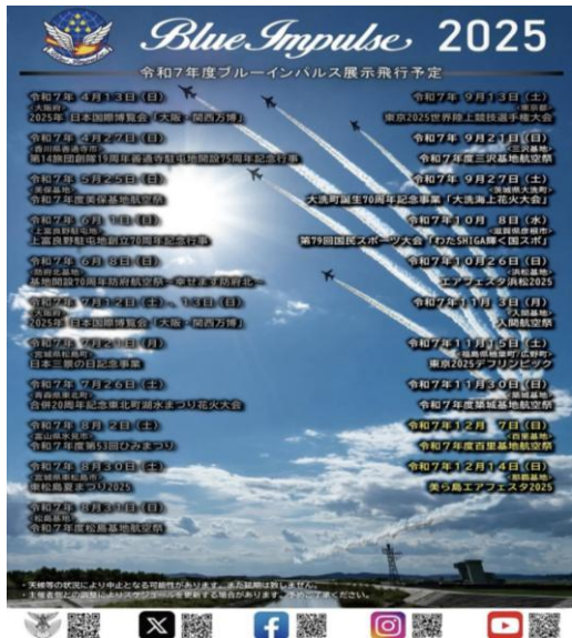
航空自衛隊Instagramから引用