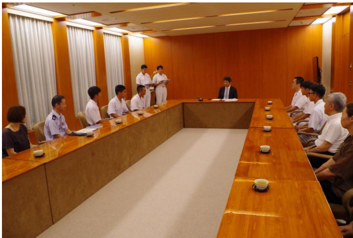
県知事へ帰郷報告する学生

県知事に夢や目標を語る 令和7年8月6日(水)茨城県庁において防 衛大学校1学年生による茨城県知事への帰郷報告 を実施した。 帰郷報告報告は、平成25年から実施している。 将来、指揮官として首長と防衛・警備や災害等へ の対応に関する対話をするに当たり、その雰囲気 を肌で感じ将来の糧とするとともに自衛隊や防衛 大学校への理解の促進を目的として実施している。 学生からは「防衛駐在官」や「機甲科の大隊長 を目指す」等の夢や目標を緊張しながらも県知事 に報告していた。