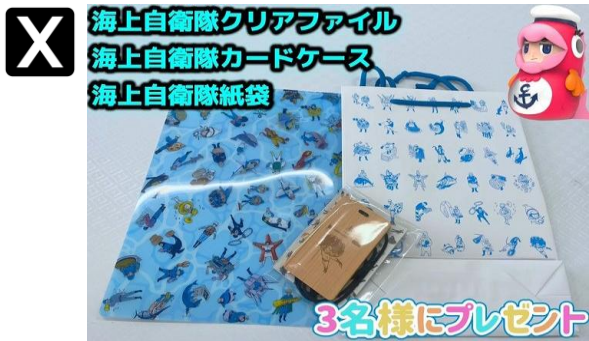
自衛隊茨城地方協力本部 @公式 @ibaraki... 2日 プレゼントクイズ企画

参加方法 ①当アカウントフォロー ②この投稿RP&回答をリプライ 正解者の中から写真の #海上自衛隊 グッズセットを 3名にプレゼント！ 当選者にはDMを送るよ！締め切りは8月3日まで。 【正解発表】 8月4日だよ