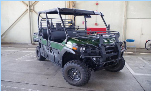
多目的走行器材 「KAWASAKI MULE PRO-FXT」