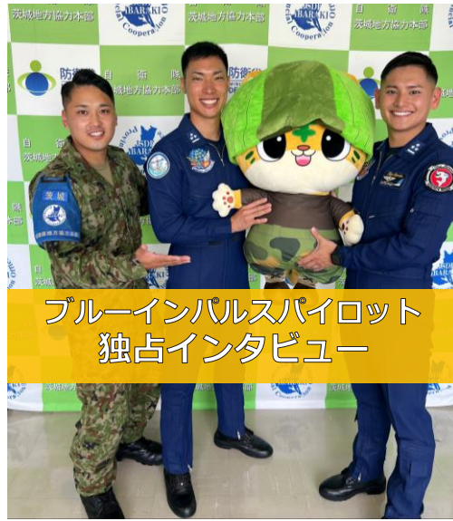
茨城地本のInstagramで公開予定