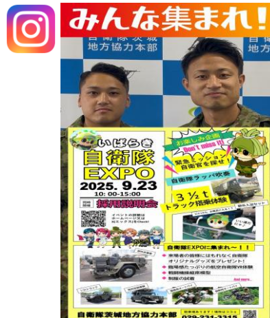
「いばらき自衛隊EXPO 2025開催」