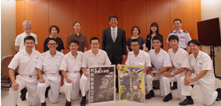
県知事と記念撮影する防衛大学生