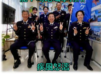
龍ヶ崎地域事務所