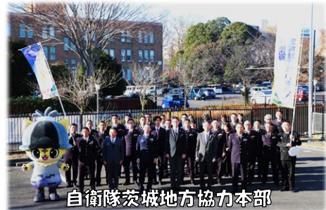
自衛隊茨城地方協力本部