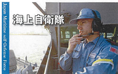
Japan Maritime Self-Defense Force