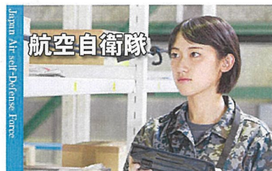
Japan Air Self-Defense Force