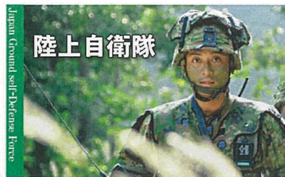
Japan Ground Self-Defense Force