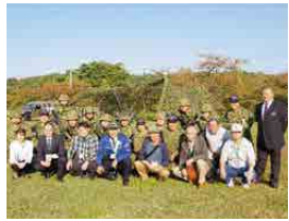
即自隊員と記念撮影