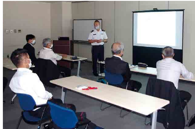
本部での教育風景

務訓練がどのような訓練なのか、具体的なイメージが湧かず苦労しました。そのような中でも、予備自衛官の練度を向上させるにはどのような訓練が効果的となるかなど、いろいろ考えて、より実効性の高い訓練を追求し、実施しました。 職務訓練を終えて、参加した予備自衛官の所感文には、「市街地広報の苦労について身をもって体験し、実のある訓練ができた。」