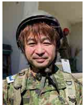
自衛隊栃木地方協力本部 予備二等陸曹