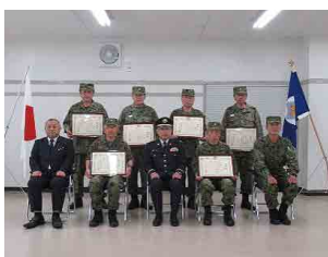
受賞者との記念撮影