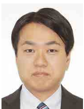
自衛隊神奈川地方協力本部 予備陸士長