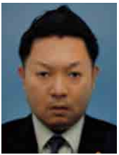
尾上敏章行政書士事務所 代表