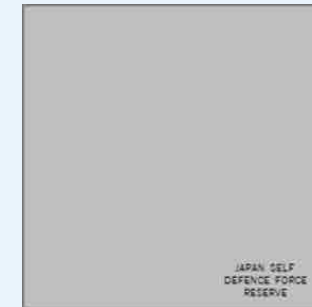
オリジナル今治製ハンカチ（約25cm×25cm） ※デザインなどは変更になる場合があります

連絡先：防衛省陸上幕僚監部人事教育部人事教育計画課予備自衛官室パワーリザーブ担当者