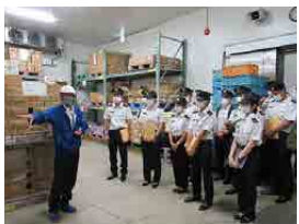
倉庫研修 (株)サトー商会