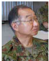
自衛隊札幌地方協力本部 予備一等陸佐