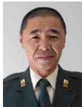
西部方面後方支援隊 第一〇一弾薬大隊 陸曹長