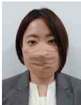
自衛隊帯広地方協力本部 防衛事務官