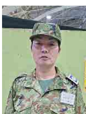
自衛隊岩手地方協力本部 予備三等陸曹