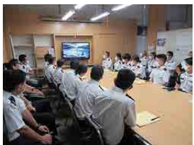
即自隊員との懇談 (株)アート引越センター