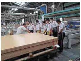
工場研修 (株)奥羽木工所