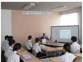
即自隊員との懇談 (株)アート引越センター