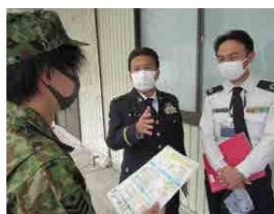
即自有資格者の勧誘

は十三回の五日間訓練を予定しており、「予備自本人及び訓練部隊と連携を図り、訓練出頭率の確保を目指す」としている。