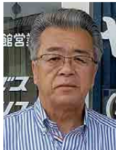
ヤマカ運輸株式会社 代表取締役