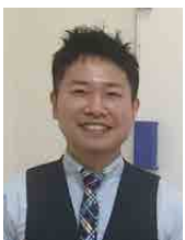
自衛隊大阪地方協力本部 予備二等陸曹