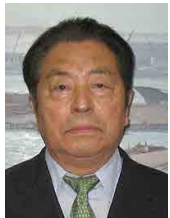
株式会社佐藤海事 代表取締役