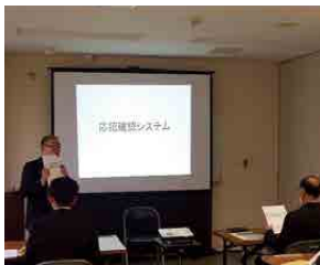
応招確認システム