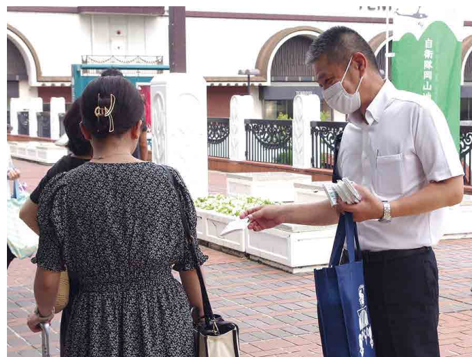
実地訓練（市街地広報）

との声があり、昨年度からの更なる進化として新たに取り入れた実地訓練により、隊員のスキルアップにつながる訓練になったと実感しています。 今後も、予備自衛官の職務の練度を更に向き上げ、新たなアイデアがあればそれを取り入れ、職務訓練を継続していきたいと思えます。