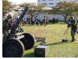
120mm迫撃砲陣地進入訓練