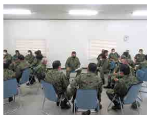
現職自衛官との懇談