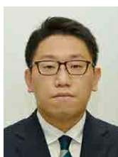
自衛隊青森地方協力本部 防衛事務官