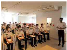
雇用企業説明 (株)サトー商会