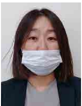
自衛隊帯広地方協力本部 予備准陸尉