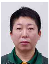
自衛隊千葉地方協力本部 予備三等陸曹