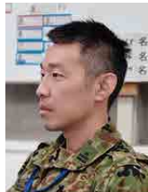
東部方面システム通信群 第二〇五基地システム通信大隊 三等陸佐