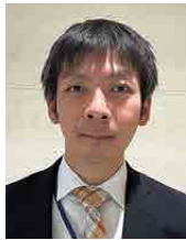
自衛隊岡山地方協力本部 防衛事務官