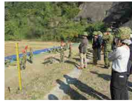
小火器射撃検定研修

を目的の当たりとした企業主等は、「改めて自衛隊の存在と即自隊員の重要性を認識した」と語り、即自制度に理解を示していた。 宮城地本では「今後も部隊と連携を図り、雇用企業主等への研修等を通じて即自予備自制度の更なる理解促進に努める」としている。