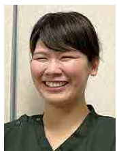
自衛隊岩手地方協力本部 予備三等陸曹