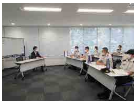
即自隊員との懇談 (東洋ワークセキュリティ(株))