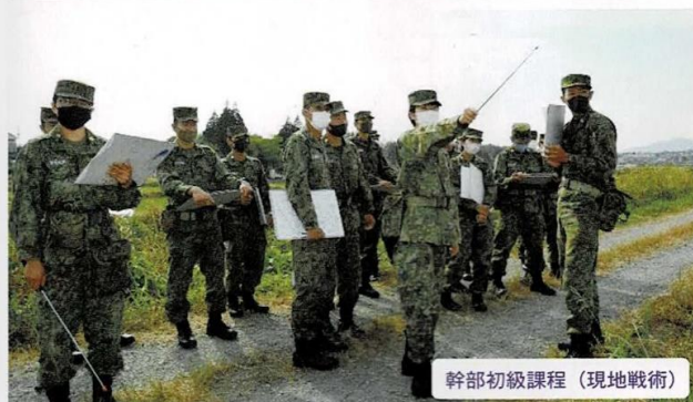
幹部初級課程（現地戦術）