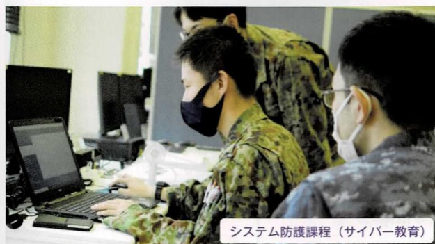
システム防護課程（サイバー教育）

複雑化する現代の作戦環境に適切に対応できるよう、サイバー、電子戦等の新たな領域や、水陸両用作戦、空挺作戦等の従来領域における各種作戦に必要な教育を実施しています。