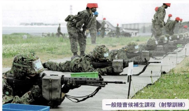
一般陸曹候補生課程（射撃訓練）