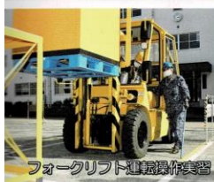
フォークリフト運転操作実習