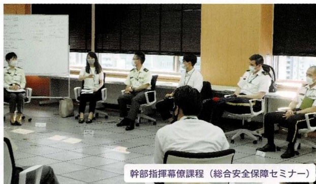
幹部指揮幕僚課程（総合安全保障セミナー）