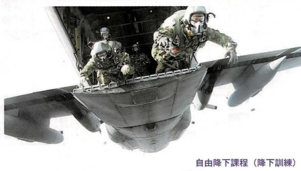
自由降下課程（降下訓練）