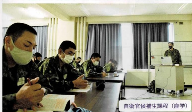
自衛官候補生課程（座学）