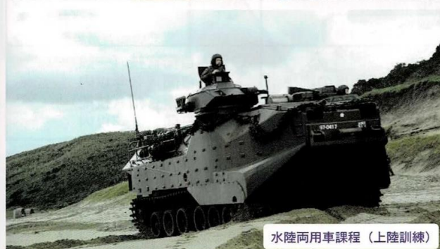
水陸両用車課程（上陸訓練）