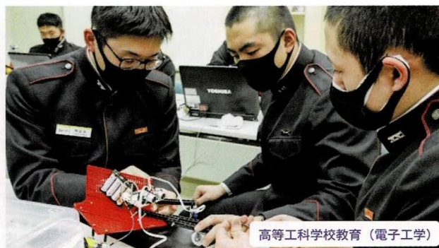
高等工科学学校教育（電子工学）