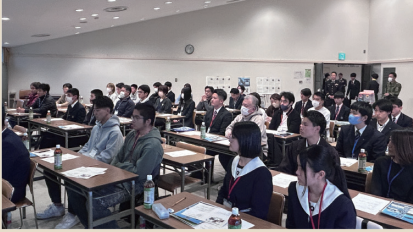
教育隊の概要、営内生活、福利厚生等