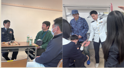
意見交換や情報共有等活用してください