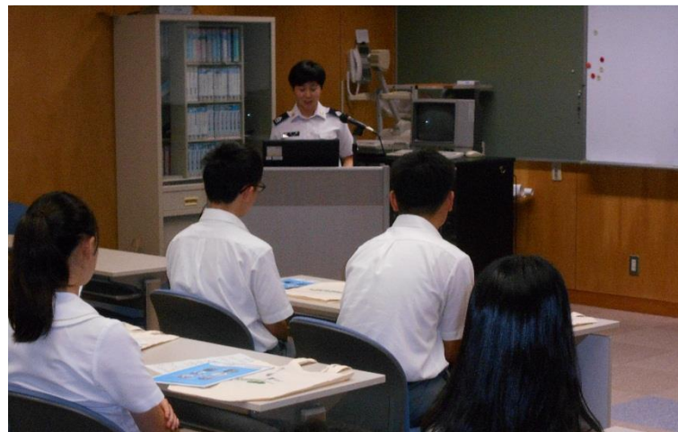
熱心に聞き入る参加者

いわき地域事務所は、8月28日（水）磐城緑陰高校において防衛医科大学校説明会を実施し11名（2年生以下）の生徒が参加しました。