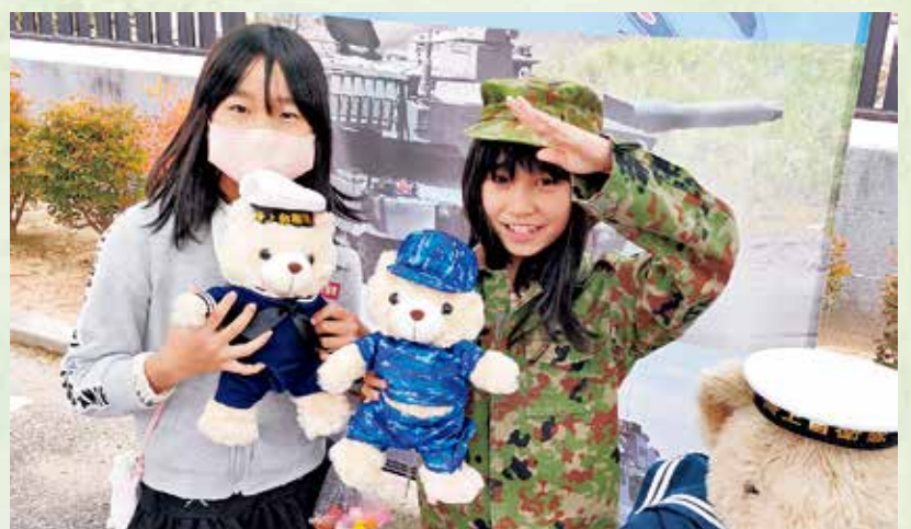
第23回そうま市民まつり