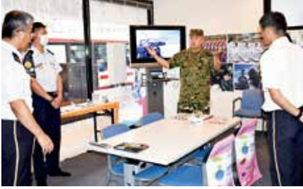
東北方面総監部幕僚副長（右：行政副長 左：防衛副長）