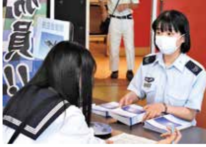
安西空士長（警戒航空団）

令和5年9月25日、「女性隊員会同」を実施し、働きやすい職場環境づくりについて意見交換を行いました。本会同は今後も継続する計画であり、悩みなどを共有し、女性の活躍を推進できるよう女性隊員同士の交流を深めていきたいと思えます。