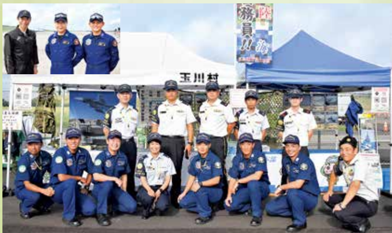
福島空港開港30周年記念 2023福島空港「空の日フェスティバル」支援