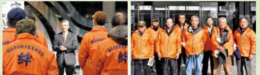
(協力団体及び募集相談員)