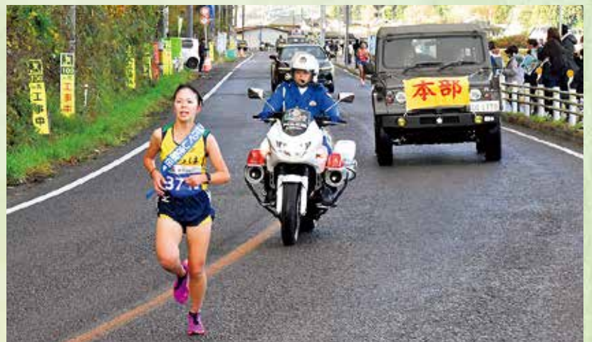
第35回市町村対抗福島県縦断駅伝競技大会 (ふくしま駅伝) 車両支援