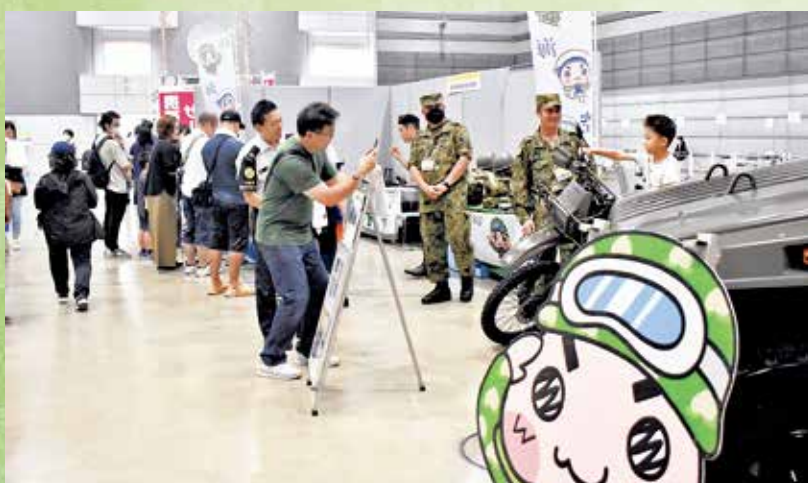
総合防災イベント「そなえる・ふくしま2023」 ～いのちを守るマイ避難～