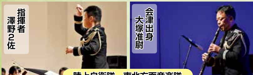
陸上自衛隊 東北方面音楽隊