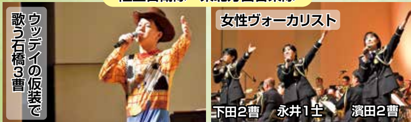
会津若松市自衛隊音楽祭支援