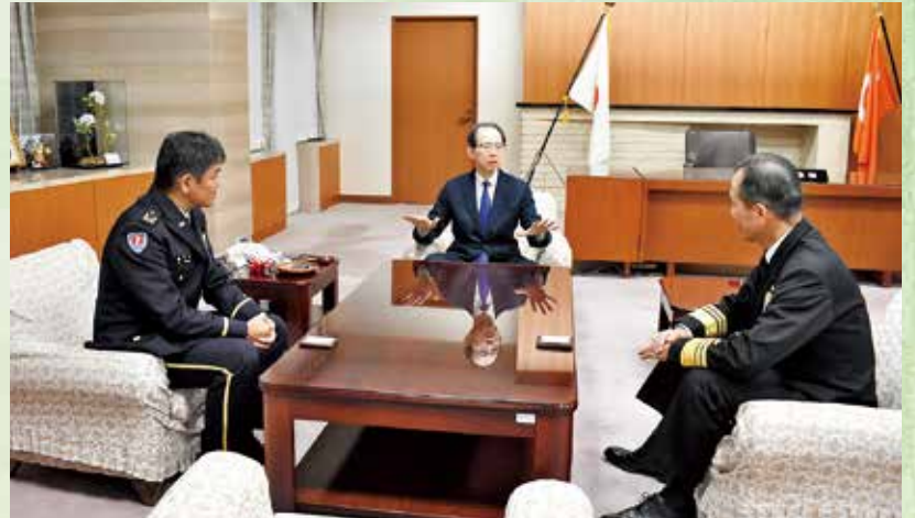
横須賀地方総監福島県知事表敬同席