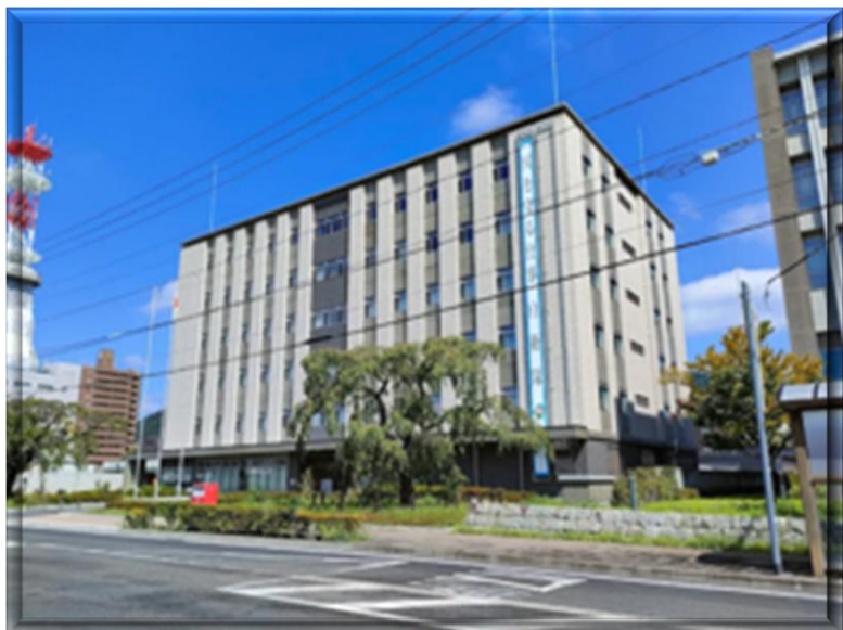
福島第二地方合同庁舎 (正面側)