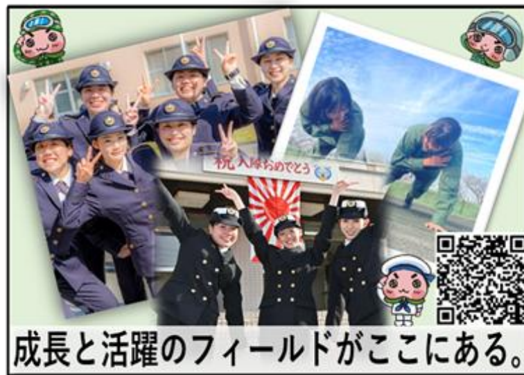
図一採用広報用チラシデザイン案