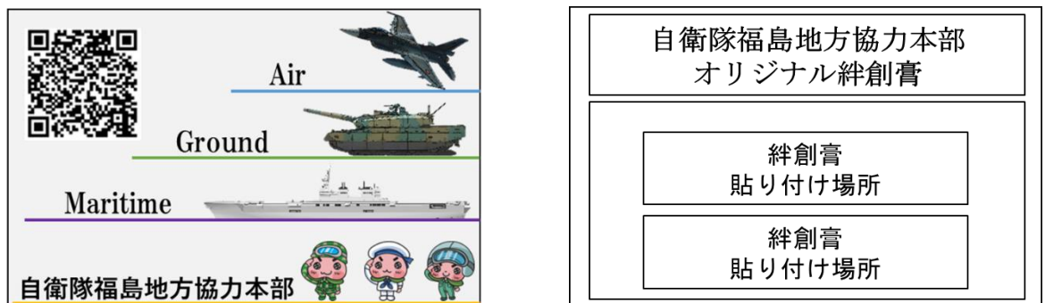
図－絆創膏台紙デザイン案