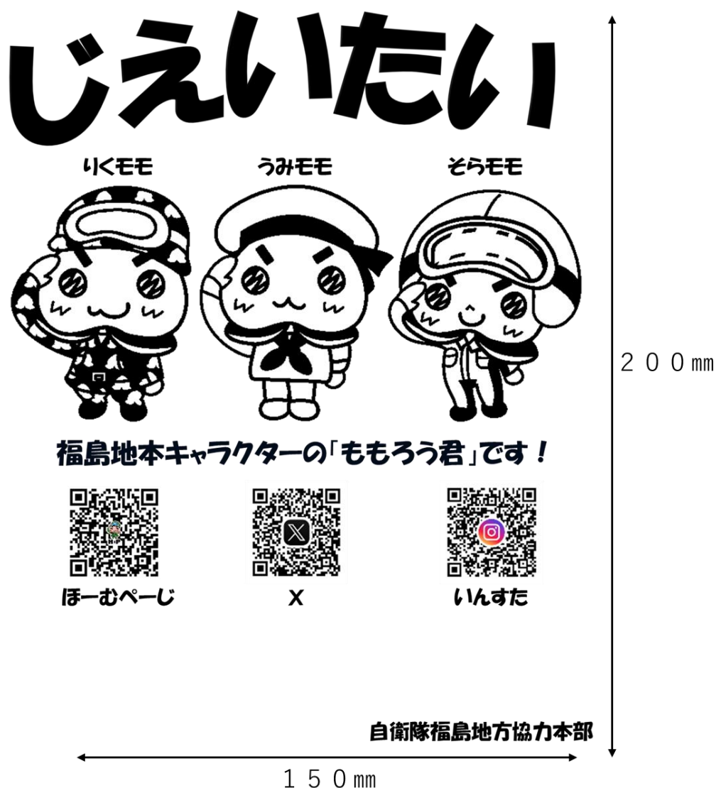
図1における文字，図形及びイラストについては，以下の表3のとおりとする。