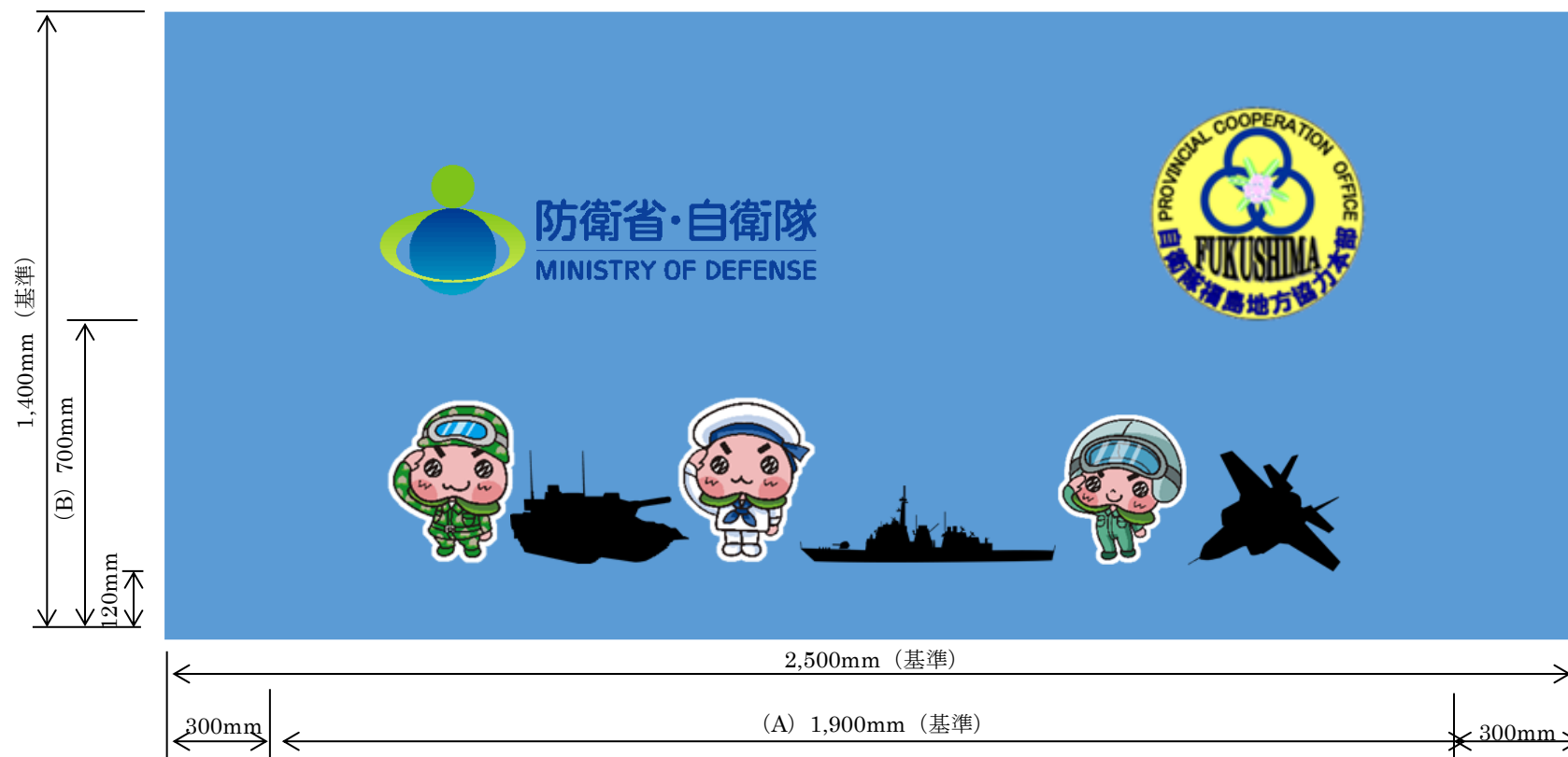
図2—テーブルクロスデザイン案

注記1 テーブルクロスの規格が1,400mm×2,500mm以上の場合、長辺両端から各300mm程度を除いた(A)及び短辺(B)の範囲に図及び文字を印刷すること。