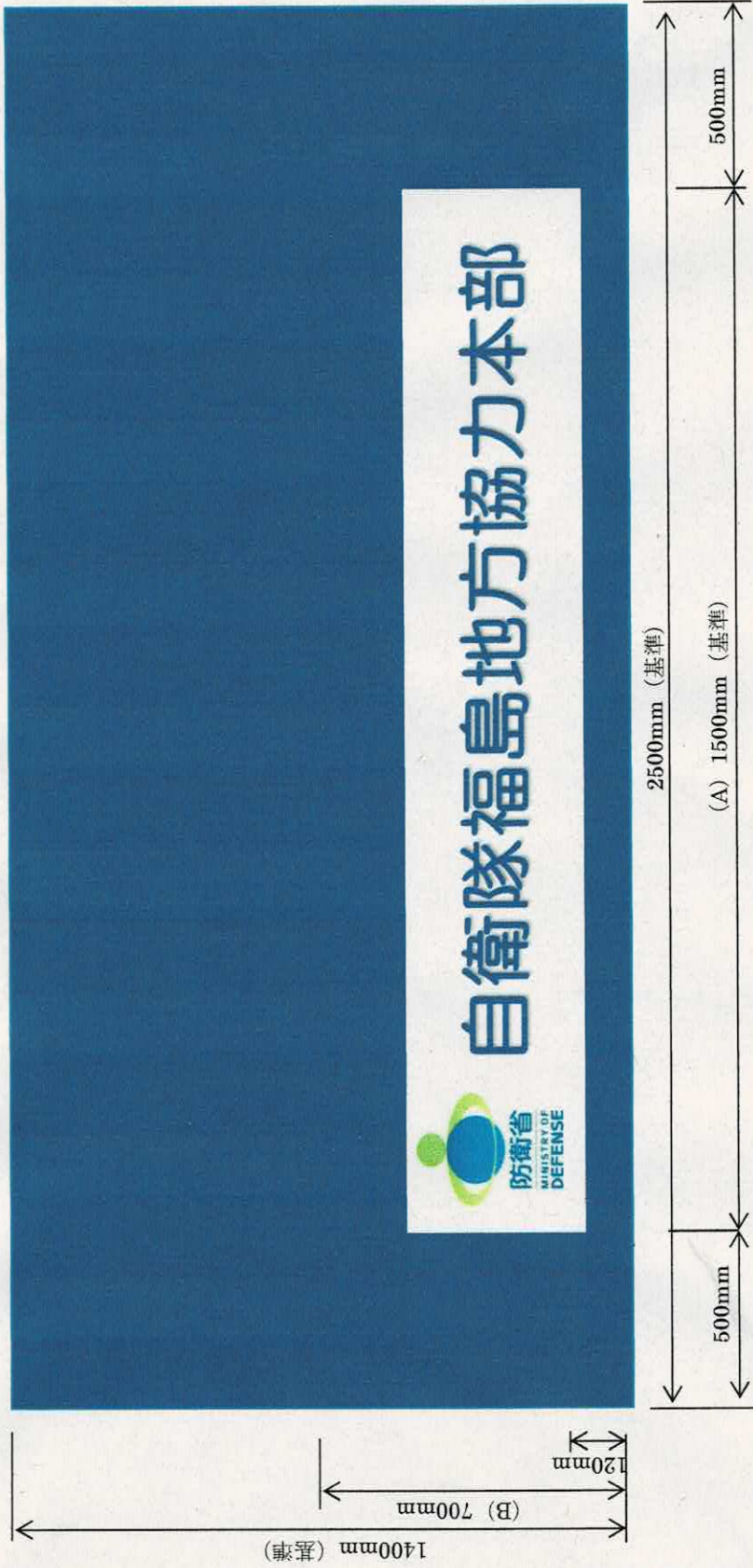
図2—テーブルクロスデザイン案

注記1 長辺両端から各500mmを除いた (A) 及び短辺 (B) の範囲に図及び文字を印刷すること。