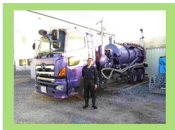
大型ダンパー車前