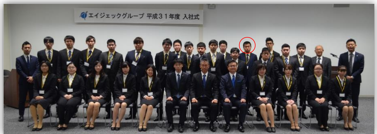
（ファクトリーサポート職）