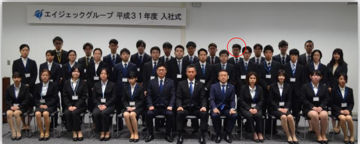
（プロジェクトサポート職）

大卒、短大卒等約220名の中に任期制隊員2名が参加 於：JR博多シティ（2019年度）