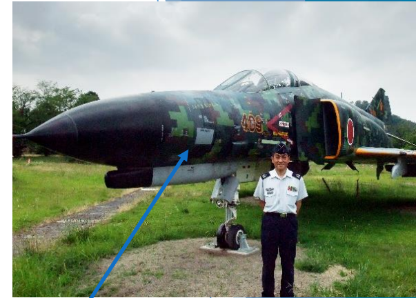
各務原飛行場100周年 記念塗装機「F-4EJ 409号機」

航空自衛隊で保有している航空機は、F-15型戦闘機をはじめ、20種類以上あり、それぞれ整備に必要な部品が、合計すると数十万品目に上ります。私は、その一つ一つを過不足なく部隊へ届ける役割を担っており、いわゆる縁の下の力持ちとして日々、やりがいを感じながら仕事をしています。