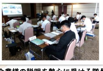
企業様の説明を熱心に受ける隊員