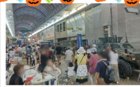
賑わいをみせる会場の様子

今回「おんまぐ」は今治市合併20周年事業の一つとして「MOVE」動くをテーマに実施され、2日間で約25万人と非常に多くの人出で大いに盛り上がりました。この中で、自衛隊広報ブースは、今治商店街及び美須賀コミュニティプラザ前で出展し、第15即応機動連隊から支援を受けた軽装甲機動車(LAV)や高機動車の展示をはじめ、制服試着コーナー、VR体験など多くの人で賑わいました。このイベントを通じて、市民の皆様には各種展示や現場の隊員とふれあっていたり、さらには自衛隊を身近に感じていただけたように思います。今治地域事務所では、今後も自衛隊が身近な存在になれるよう、引き続き様々な場で皆様の心に残るイベントを開催してまいります。 最後になりますが、猛暑の中多大なご支援をいただきましたおんまぐ実行委員の皆様、今治商店街の皆様、第15即応機動連隊の皆様には感謝申し上げます。