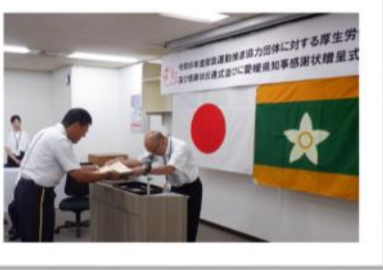
感謝状を受領する本部長

令和6年7月25日（木）愛媛県庁において、令和6年度献血運動推進協力団体等に対する愛媛県知事感謝状贈呈式が行われました。