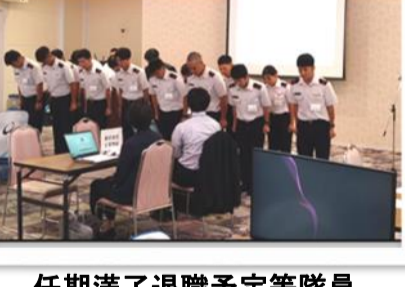
任期満了退職予定等隊員

今年度の特性として、任期満了退職予定等隊員への手厚い再就職援助の現状を確認していただくことを目的に、愛媛県内の高等学校の進路担当教諭等に本説明会のご案内をさせていただきました。4校（4名）の進路担当教諭等の方々にご参加いただきました。この際、「自衛官を任期満了退職することに当たり、このような手厚いバックアップがなされていることは存じておりませんでした。素晴らしい施策だと思います。」等のご意見をいただきました。 併せて、運送業界等の現状把握のため、国土交通省四国運輸局愛媛運輸支局、愛媛県企画振興部政策企画局地域政策課交通政策室、同観光国際課航空政策室からもご参加いただきました。 本説明会を通じて、参加隊員の再就職後の自己のイメージを具体化させるとともに、再就職の準備に寄与することができました。参加隊員からは、「自己の将来設計に大変参考になりました。」「質問しやすい雰囲気であったことを詳細に聞くことができました。」「企業との面談は緊張しましたが、説明が分かりやすく、再就職後のイメージアップができました。」「等の好評を得ました。 参加企業からは、「面談時の対応要領が素晴らしかった。」「是非とも入社を検討していただきたい。」「等の前向きな意見を頂戴いたしました。 今後も退職予定隊員が新しい生活をスタートできるよう、全力でお手伝いいたします。