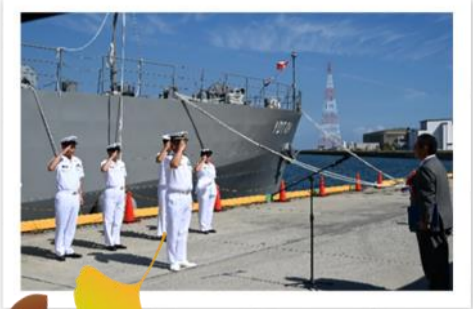
入港歓迎式行事「西条市長」