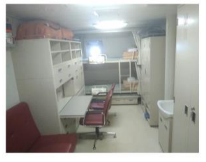
整理整頓された居室