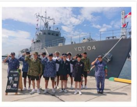
職場体験学習を実施 「西条市立西中学校及び南中学校の生徒の皆様」