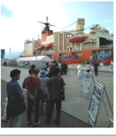
受付時間と同時に長蛇の列