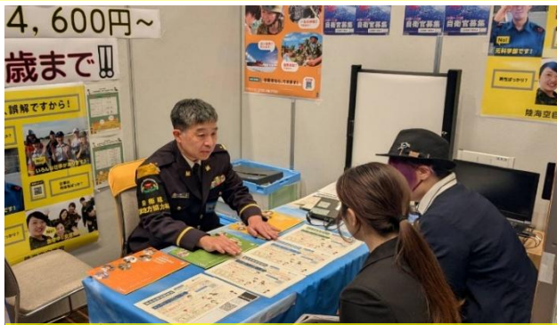
マイナビ転職での説明会