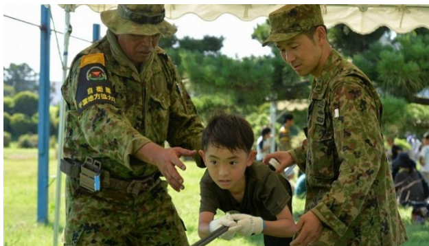
こどもキャンプ in 下志津