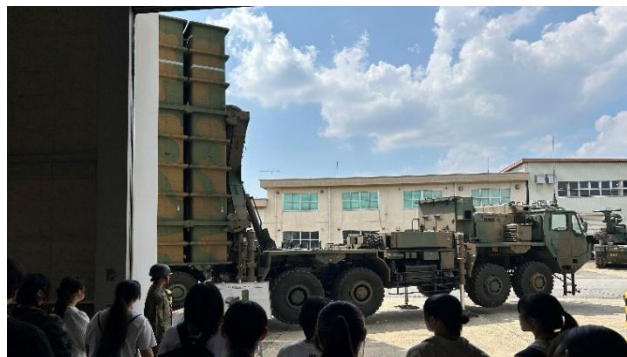
高射学校ツアー in 下志津