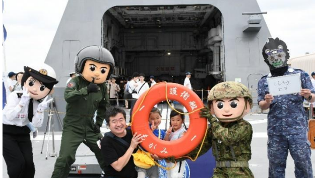
艦艇広報 (護衛艦もがみ)