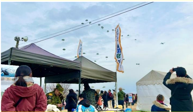
第1空挺団訓練始め (NYJIP)