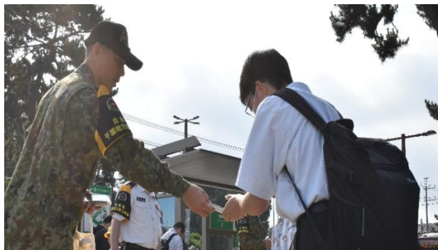
サマキャン市街地広報