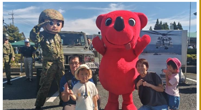
千葉県及び睦沢町主催の防災フェア