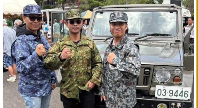
文化ふれあいイベント