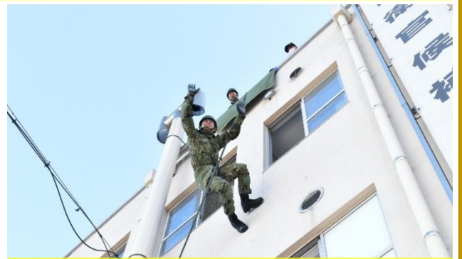
本部隊舎で特殊訓練!