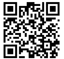
千葉地本ホームページ