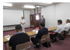
新規募集相談員説明会 (R1.7.8) (本部)