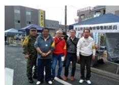
募集相談員による募集活動 (R1.11.3) (実柵ふる里祭り)