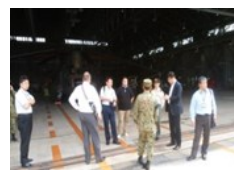
新規募集相談員部隊研修 (R1.7.8) (木更津駐屯地)