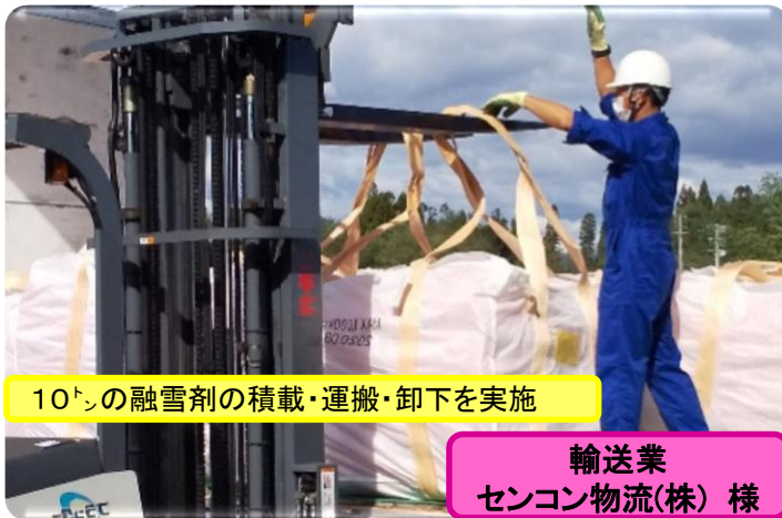
10tの融雪剤の積載・運搬・卸下を実施