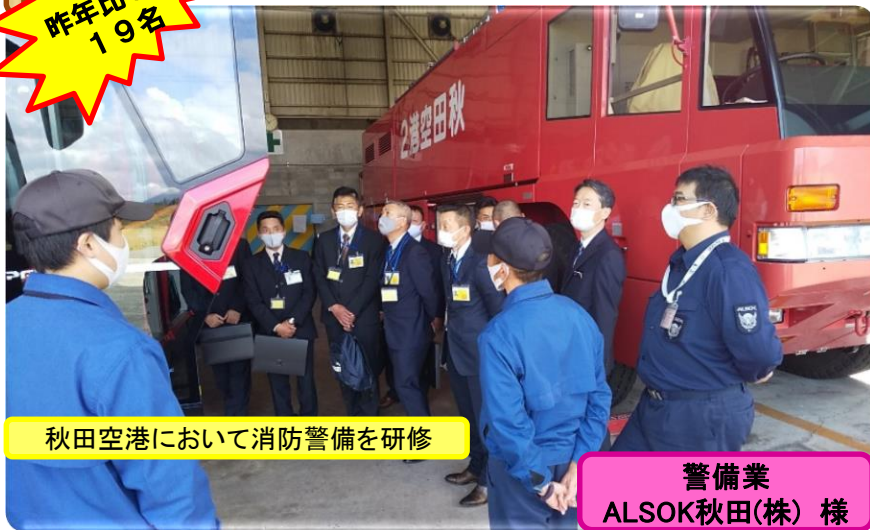
秋田空港において消防警備を研修