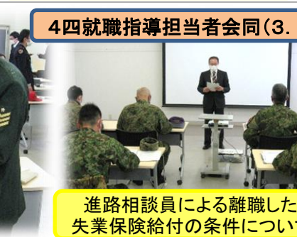
4四就職指導担当者会同(3. 1. 12)