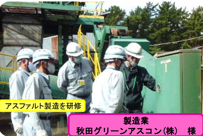
アスファルト製造を研修