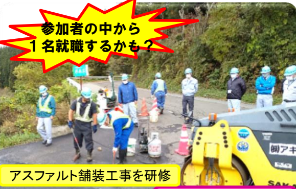
アスファルト舗装工事を研修