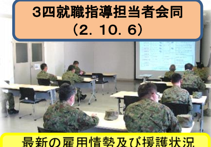
3四就職指導担当者会同 (2. 10. 6)