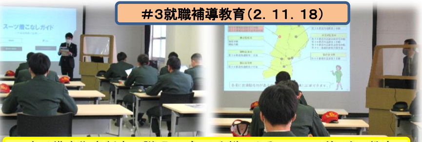
#3就職補導教育(2. 11. 18)