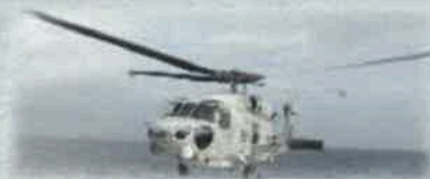
搭載ヘリコプター (SH-60K/60J)