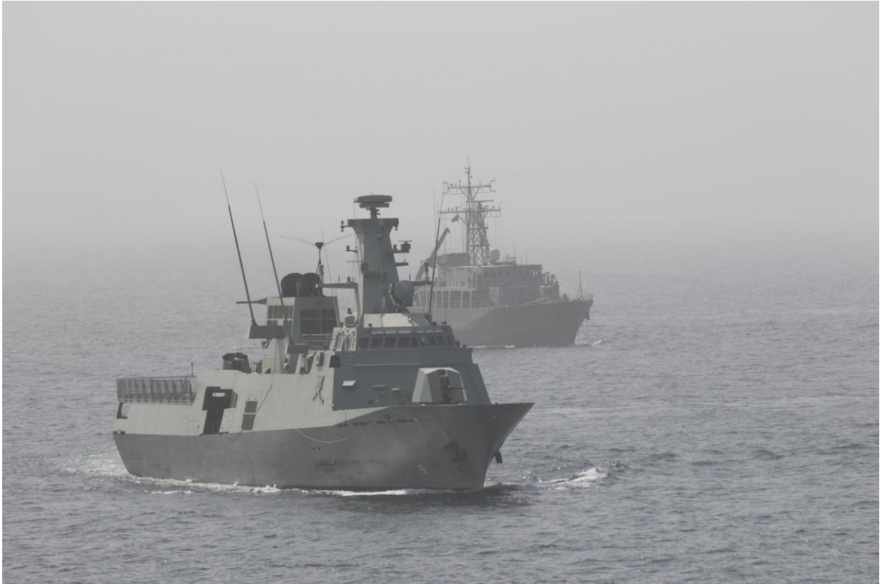
左から「ザーダフ」、「えたじま」