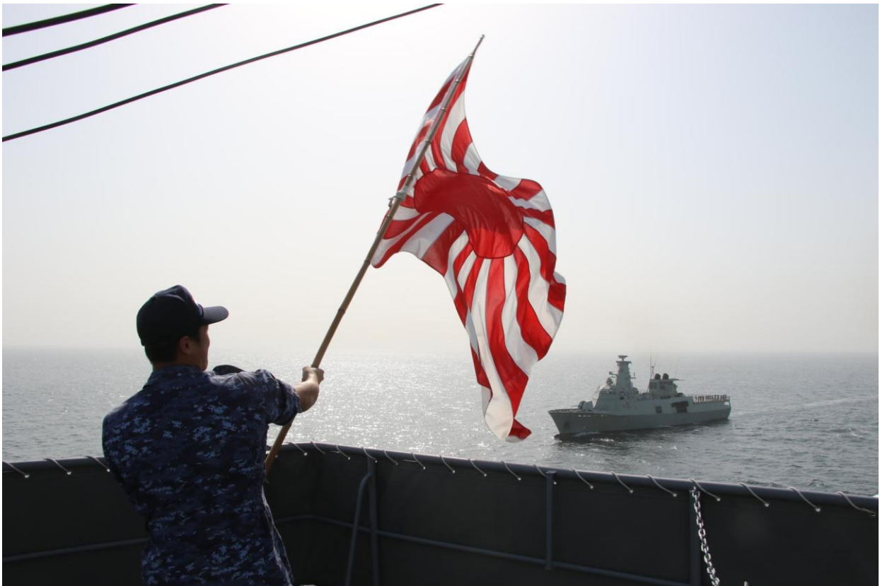
「ザーダフ」を見送る海自隊員