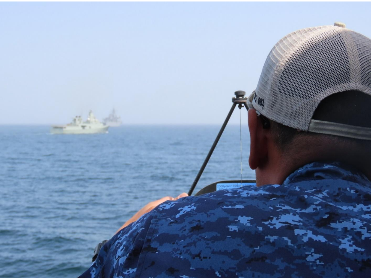
訓練中の海自隊員