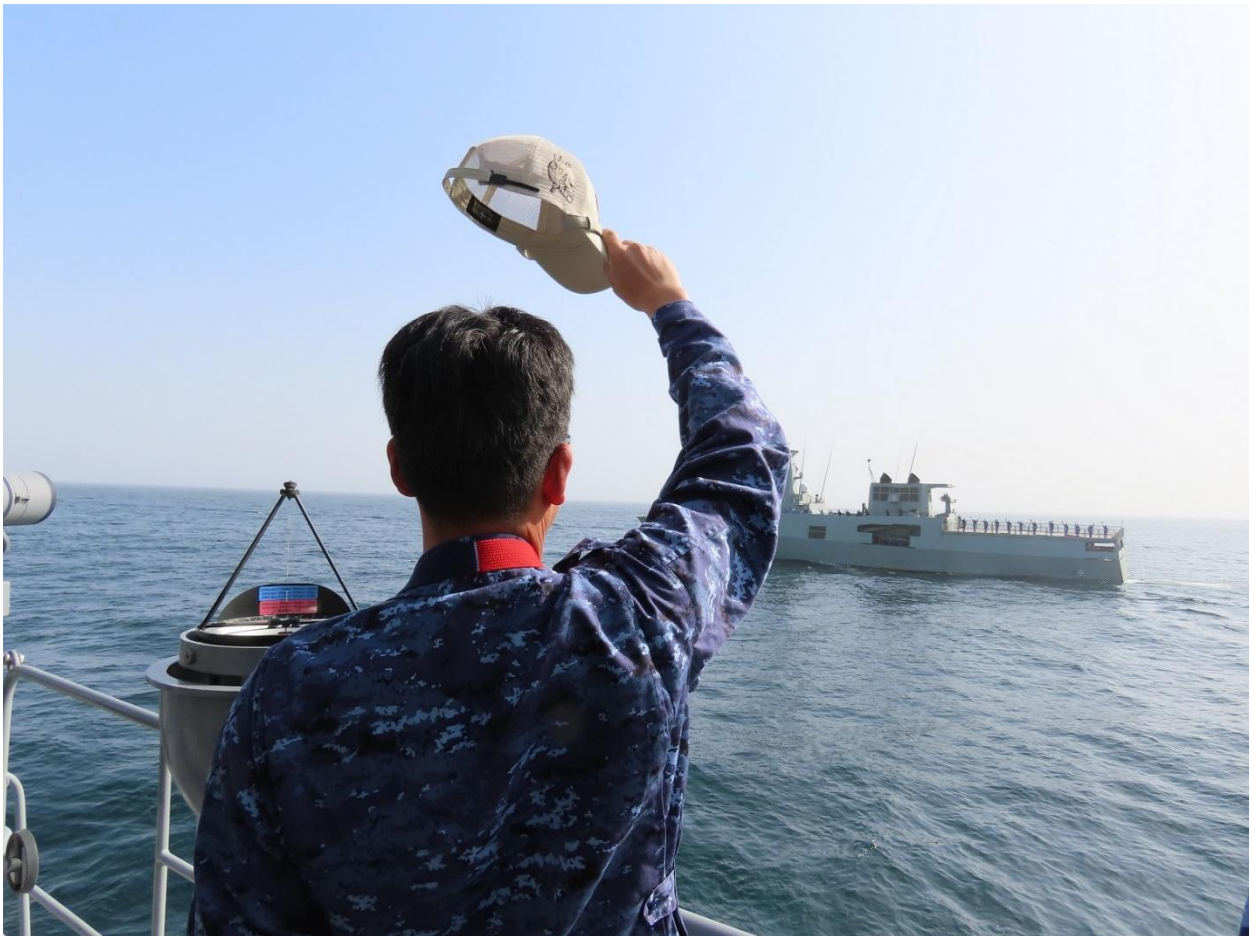
「ザーダフ」を見送る海自隊員