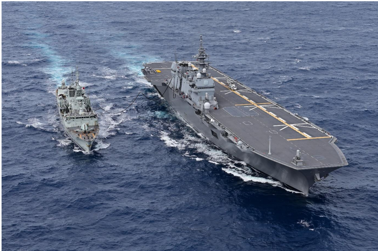
左からフリゲート艦「ウィニペグ」、護衛艦「いずも」