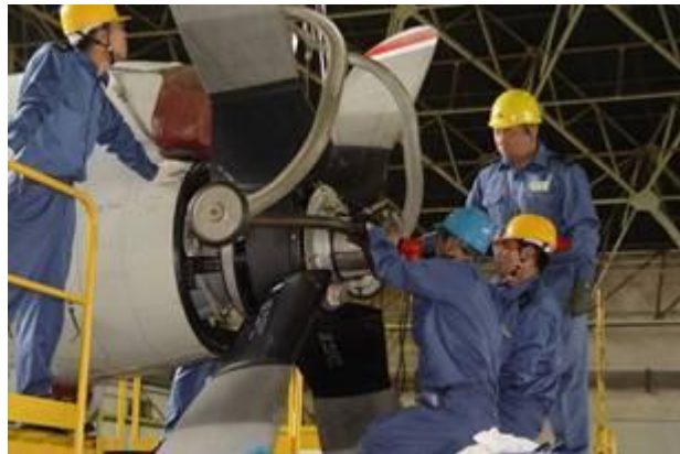
(エンジン整備作業)

全国13カ所(大湊、八戸、下総、館山、厚木、舞鶴、徳島、小松島、岩国、小月、大村、鹿屋、那覇)の航空基地及び全国5カ所の総監部(大湊、横須賀、舞鶴、呉、佐世保)を母港とするヘリコプター搭載護衛艦、砕氷艦「しらせ」、さらに第3術科学校等の教育部隊などがあります。