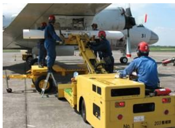
(固定翼機へ弾薬搭載)

固定翼部隊(厚木、下総、八戸、鹿屋、岩国)、回転翼部隊(館山、大湊、舞鶴、小松島、大村)、第3術科学校等の教育部隊などがあります。