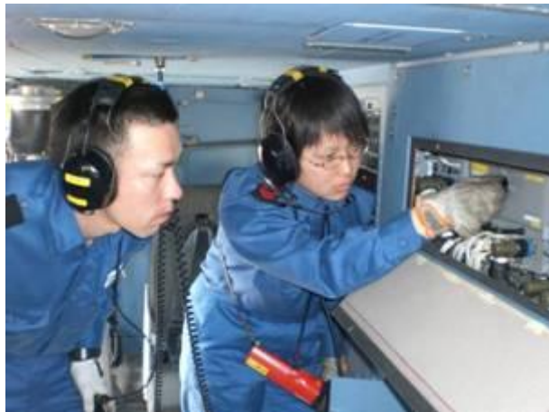
(ヘリコプターの飛行準備)

全国13カ所(大湊、八戸、下総、館山、厚木、舞鶴、徳島、小松島、岩国、小月、大村、鹿屋、那覇)の航空基地及び全国5カ所の総監部(大湊、横須賀、舞鶴、呉、佐世保)を母港とするヘリコプター搭載護衛艦、第3術科学校等の教育部隊などがあります。