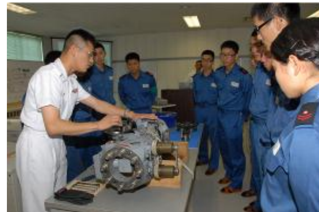
(回転翼学生の教務風景)

元気、元気！ 毎日、ヘリコプターの整備を楽しんでいます。 機体整備員は、整備から溶接、板金工作まで何でもできます。