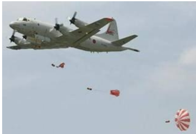
(整備した物糧傘が投下される)