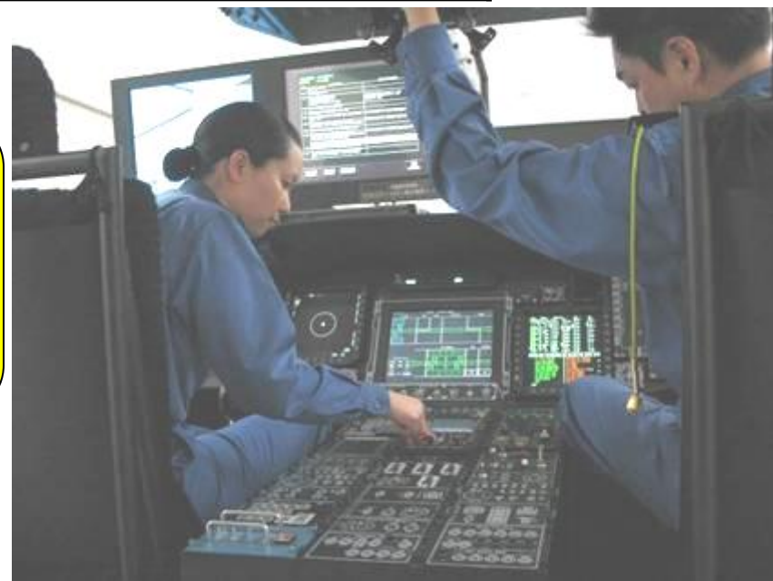
(SH-60K対潜ヘリコプター整備実習)