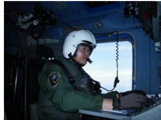
(ヘリコプターに乗務する航空士)