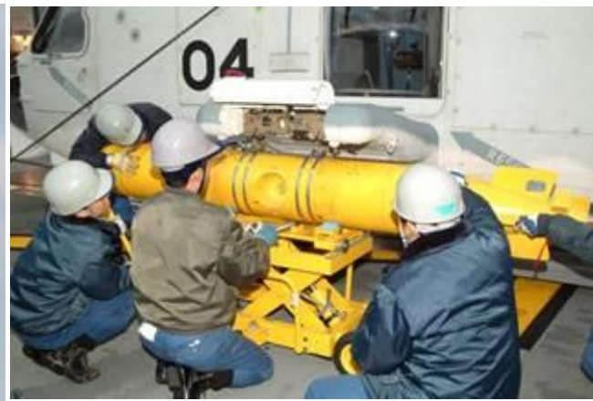
(回転翼機へ弾薬搭載)