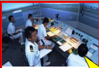
シミュレーターでの訓練