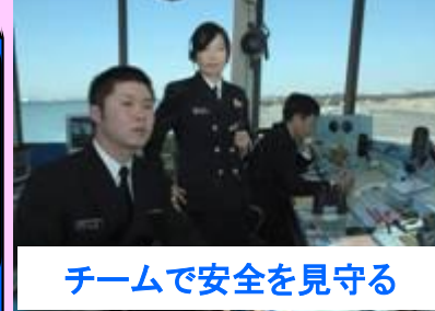
チームで安全を見守る

最初はみんな初心者！ しっかり訓練するので、 どんな状況にも冷静に対 応できるようになります。