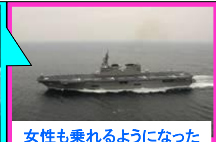
女性も乗れるようになった