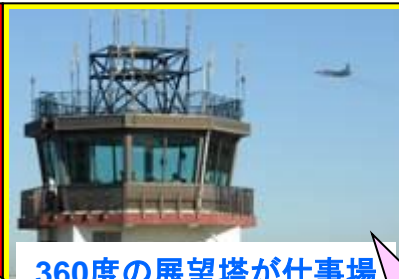
360度の展望塔が仕事場