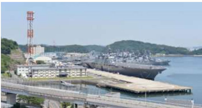
★横須賀地方総監部庁舎と護衛艦「いずも」（※艦艇での作業等はありません）

メールアドレス： y rh-jinjssystem@inet.msdf.mod.go.jp