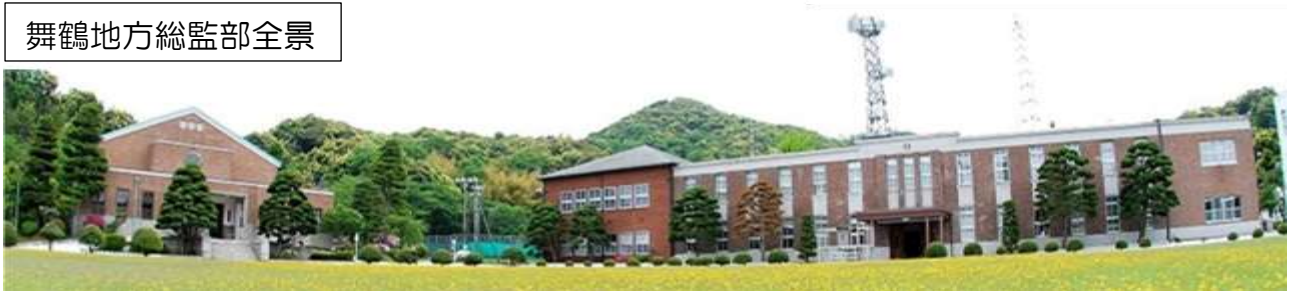
舞鶴地方総監部全景