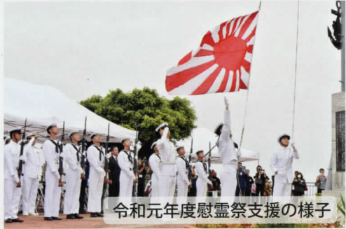
令和元年度慰霊祭支援の様子