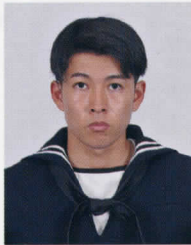
第5整備補給隊 菖蒲 士長

これからも多くの人の出会いや、困難な出来事が待ち受けているかもしれませんが、感謝を忘れず、積極的に行動できる社会人を目指し、胸を張って頑張っていきたいと思えます。