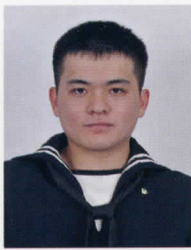
第5整備補給隊 武士 長

これから成人として多くの決断をしなければならぬ場面があると思います。成人としての自覚を持ち、自分の行動には責任を持って大人になれるよう精進します。