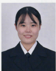
第5整備補給隊 福岡 士長

私の新成人としての抱負は「感謝の気持ちを忘れず、責任と自覚ある行動」です。今日まで育ててくれた両親への感謝の気持ちを忘れず、成人として求められる責任を自覚し、諸先輩方に一日でも早く追いつけるよう努力し、職務を遂行していきたいと思います。