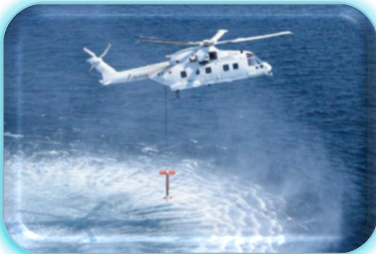
【 掃海中のMCH-101 】

日々、海上自衛隊航空集団は、わが国周辺海域の防衛にあたっています。 航空集団に所属する航空機及び隊員のインタビューを紹介します。今回は、 回転翼機として掃海・輸送の分野で活躍する「 MCH-101 」です。