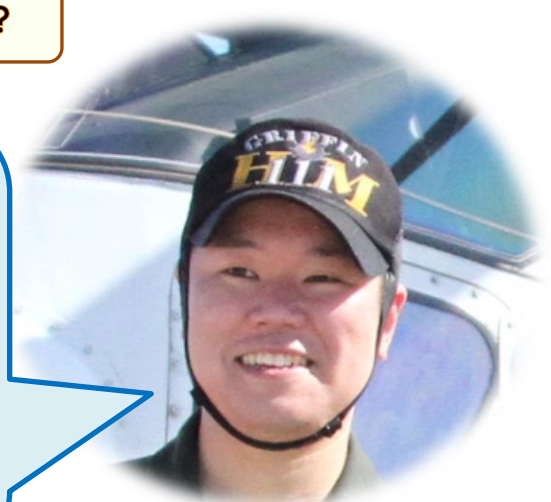
【 配置 PILOT 】