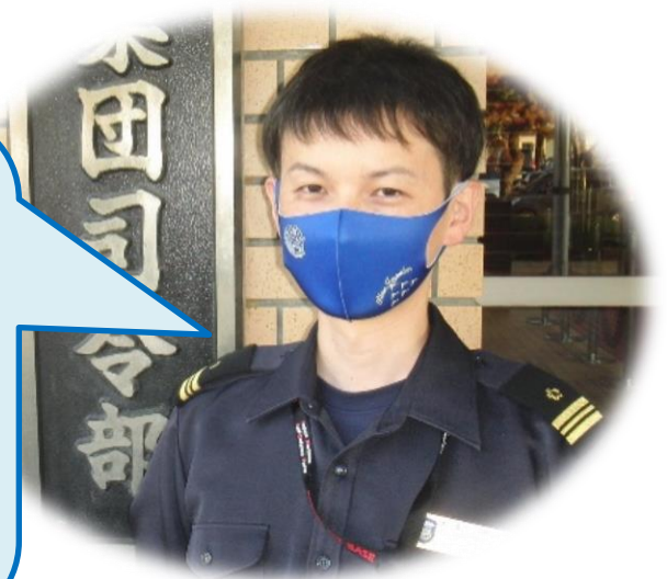
【 配置 TACCO 】