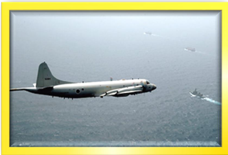
【 警戒監視中のP-3C 】

日々、海上自衛隊航空集団は、わが国周辺海域の防衛にあたっています。 航空集団に所属する航空機及び隊員のインタビューをご紹介します。今回は、 固定翼哨戒機として活躍する「 P-3C 第2弾 」です。