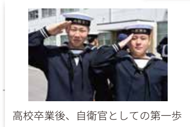
高校卒業後、自衛官としての第一歩

艦艇に乗り組むと基礎給との43%、潜水艦では55.5%、航空機では30~75%の手当が支給されます。