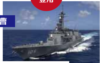
艦艇乗り組みとなる初の大海原へ!

休暇制度 ●毎月2日(年間24日)の年次休暇(有給)が付与されます(翌年度に30日繰越可能)。 ●夏季3日、冬期6日、親族が死亡した場合は最大7日(父母の場合)の特別休暇(有給)が付与されます。 ●条件を満たした場合、90日の病気休暇(有給)が付与されます。