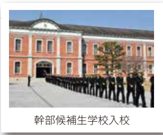
幹部候補生学校入校

災害派遣などの際の緊急登庁時に、預け先がない子供を基地内の施設などでおおむね5日間程度、一時的に預かる制度があります。長期にわたり国内外に派遣される場合には、家族と隊員が連絡を取る手段としてテレビ電話や無線通信環境の整備を実施します。