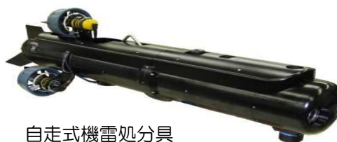
自走式機雷処分具